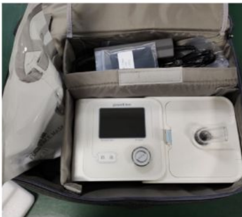
Uno de los mil respiradores no invasivos Yuwell 730, donados por BBVA y ya distribuidos por los hospitales españoles.

Ha ofrecido distintas facilidades a sus clientes particulares –como el adelanto del pago de las pensiones o de la prestación de desempleo– y a pymes y autónomos, a través de créditos rápidos de financiación. Además, ha impulsado un plan de acciones que se traducen en la donación de 35 millones de euros, el reparto de más de 1.000 respiradores en hospitales de todo el país o la iniciativa ‘Tu aportación vale el doble’ en la que, por cada euro aportado por uno de sus trabajadores, el banco contribuirá con un euro más.